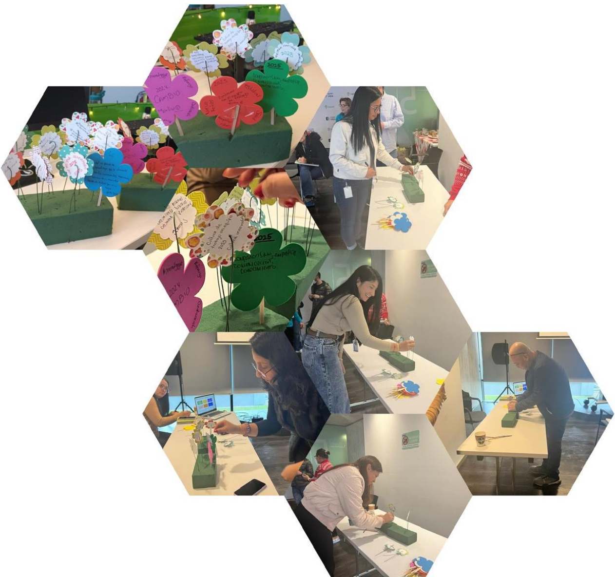
Imagen 7. Actividad Siembra y Cosecha

La segunda parte del encuentro estuvo dedicada al cierre de la estrategia de fortalecimiento organizacional, abordada desde tres frentes. En primer lugar, a través de un storytelling, se narró el proceso de cambio y crecimiento del EFO durante el año, destacando los hitos alcanzados. En esta misma línea, se invitó a los agentes a reflexionar y compartir sus propios logros, identificando los objetivos que "sembraron" y los resultados que "cosecharon" como fruto de su labor. A continuación, se presentan algunos de los mejores momentos.