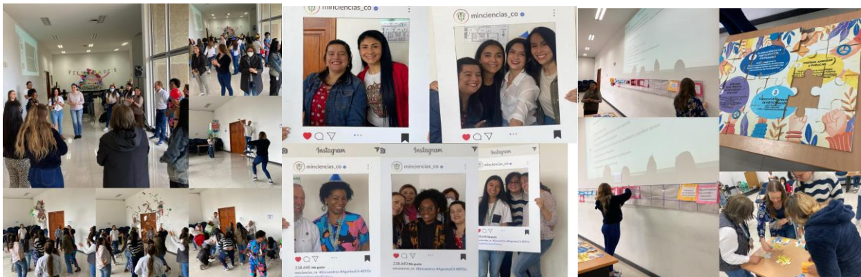
Imagen 4. Cuarto encuentro | Día del Servidor Público

Durante el evento, en primer lugar, se conmemoró el día del Servidor Público y, en esa línea, se abordaron dos temas clave enfocados en promover un servicio eficiente y fortalecer la relación entre el Estado y los ciudadanos. En primer lugar, se destacó el uso de herramientas de innovación, como el Service Blueprint, diseñada para identificar puntos de dolor en la interacción de los ciudadanos con los servicios ofrecidos por la entidad, con el objetivo de mejorar la experiencia del usuario. En segundo lugar, se recordaron las acciones definidas para fomentar una participación efectiva, subrayando la importancia de comunicar el nivel de incidencia de la participación ciudadana en el diseño y fortalecimiento de políticas públicas orientadas a responder a las necesidades de los grupos de valor. Para esta última actividad se recordó que entre todos los Agentes C4 se reconstruyó el Plan de Participación Ciudadana y se repasaron los fundamentos de la Política de Participación.