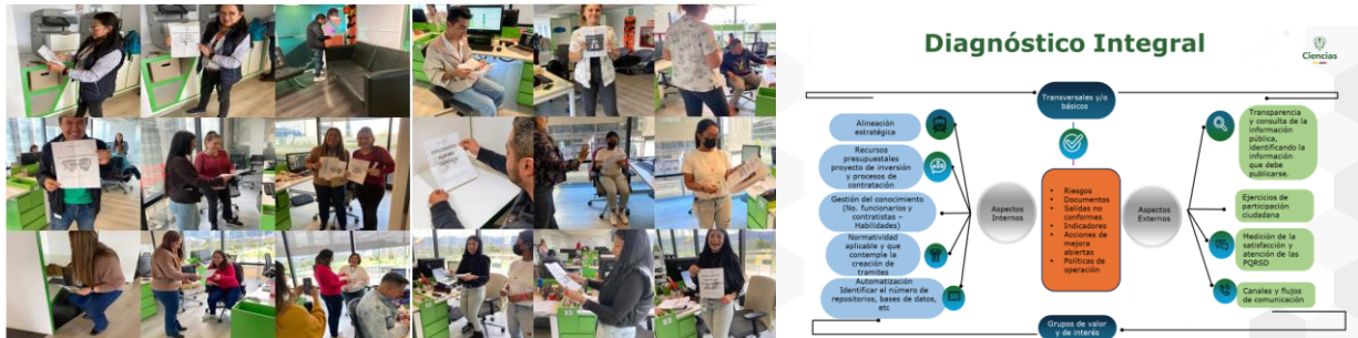
Imagen 3. Tercer encuentro | Reto de Agilismo Fase I. Diagnóstico Integral

En este se presentó la herramienta de Diagnóstico Integral bajo una actividad de circuito de agilidad en la que los agentes que se encontraban presentes en MinCiencias participaron de manera activa. Esta actividad contribuyó a explicar los diferentes componentes internos y externos que serían evaluados para cada uno de los procesos e incentivar su desarrollo.