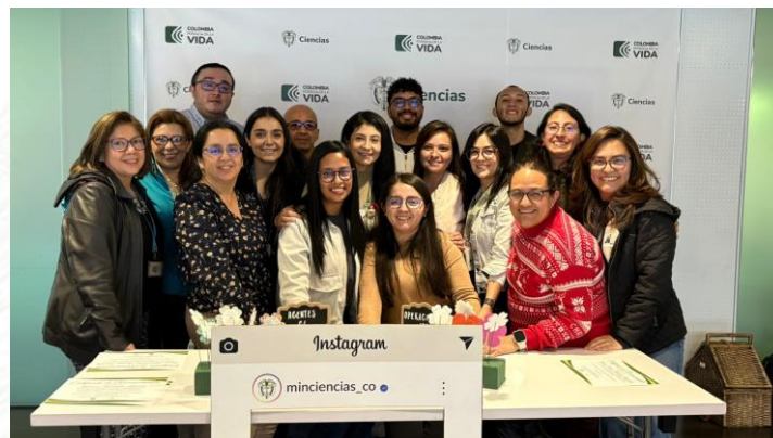
Imagen 10. Cierre Encuentro de Desarrollo de Capacidades 2024

Elaboró: Lucié Andrea Gutiérrez Contratista – Oficina Asesora de Planeación e Innovación Institucional Revisó: Erika Julieth Barragán Cabezas Contratista – Líder MIPG/Oficina Asesora de Planeación e Innovación Institucional V1_Fecha: 2024-12/31