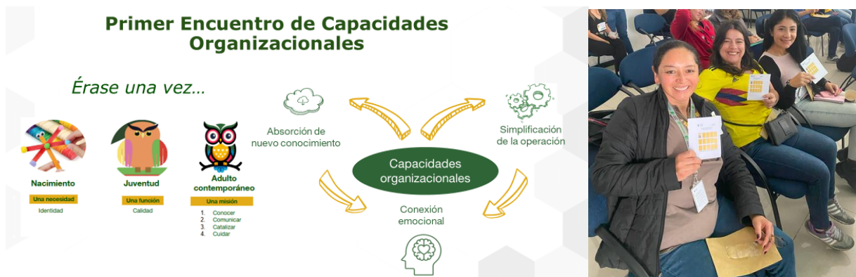
Imagen 1. Primer Encuentro | Estrategia de Fortalecimiento Organizacional

En primer lugar, se recordó que, en nuestro encuentro inicial, se presentó la estrategia de fortalecimiento y desarrollo de capacidades organizacionales, diseñada para fomentar la absorción de nuevo conocimiento, la simplificación de procesos operativos y la conexión emocional dentro del equipo. Como parte de esta iniciativa, se recordó la entrega de los cartones EFO, herramienta que se usó para acumular puntos que incentivaron y reconocieron el buen desempeño de los agentes a lo largo del año.