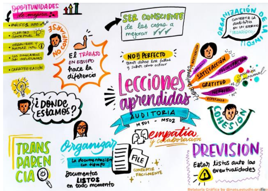
Imagen 6. Noveno encuentro | Buenas prácticas auditorías internas

En el noveno encuentro, se consolidaron, mediante una relatoría, los aprendizajes, impresiones, emociones y oportunidades de mejora identificadas en los ejercicios de auditoría interna realizados en cada uno de los procesos. Este espacio contó con la participación especial de una invitada experta en relatoría gráfica, quien compartió técnicas de escritura creativa para la elaboración de las mismas con los asistentes.