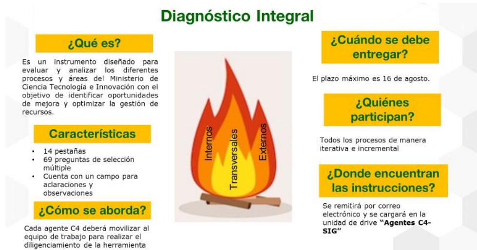
Imagen 5. Quinto encuentro | Presentación herramienta de Diagnóstico Integral

En el quinto encuentro se profundizó en cada uno de los componentes de la herramienta de diagnóstico integral haciendo una analogía a diferentes situaciones motivacionales alrededor de los juegos olímpicos.