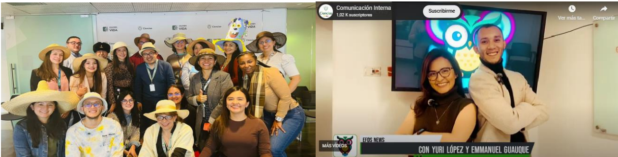
Imagen 6. Octavo encuentro | Presentación resultado EFO News

Como actividad destacada, se llevó a cabo el ejercicio de los Seis Sombreros, una metodología que permitió a los participantes abordar una problemática desde diferentes perspectivas, según el perfil asignado a cada uno conforme al color de sombrero que les correspondió. Esta dinámica fomentó el análisis integral y colaborativo de la situación planteada, haciendo uso de herramientas que aportan al proceso de toma de decisiones en entidades con contexto VUCA como el que se presenta en MinCiencias.