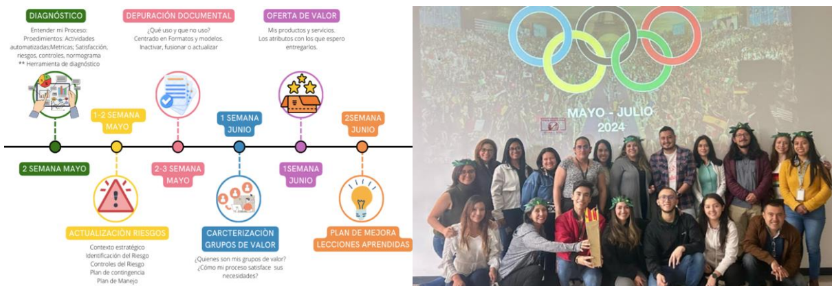
Imagen 2. Segundo encuentro | Reto Olímpico de Agilismo

Se recordó que el evento inició la Fase I del Reto de Agilismo en el marco de los juegos olímpicos, diseñada para preparar a los agentes en la catalización de procesos orientados al cumplimiento del Objetivo Estratégico No. 9: alcanzar el tercer puesto en la medición del IDI. Durante la sesión, se socializó el enfoque de agilismo como marco de trabajo, destacando su capacidad para gestionar y mejorar procesos de manera iterativa e incremental, para presentar a los agentes el plan de trabajo asociado al reto de agilismo, promoviendo su compromiso con las metas propuestas.